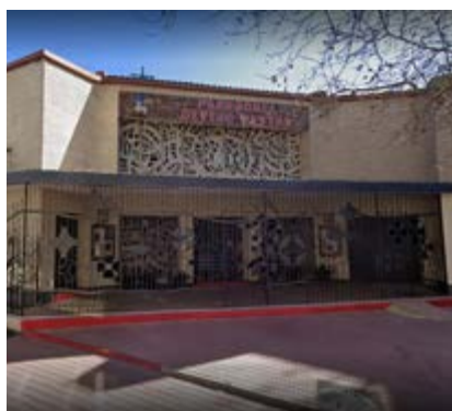
La Parroquia Divino Pastor.

Durante toda la semana conocieron las actividades de la parroquia, tuvieron encuentros de oración y visitaron diversas instituciones locales.