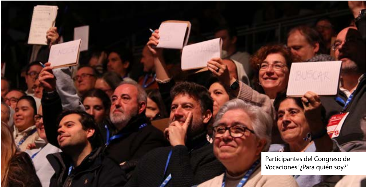
Participantes del Congreso de Vocaciones '¿Para quién soy?'