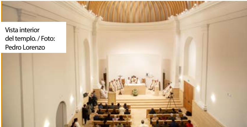
Vista interior del templo.