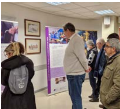
Los fieles, viendo la exposición.

La jornada concluyó con la Unción de Enfermos, seguida de un canto a la Virgen, que cerró la celebración en un ambiente de esperanza y oración.