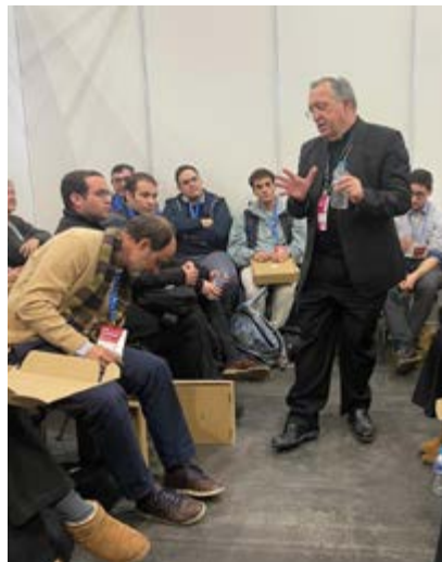
El obispo, conversando con los fieles.

Durante el congreso, se ofrecieron cuatro itinerarios temáticos: Palabra,