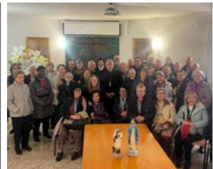
El obispo, con feligreses de la parroquia.

En Etiopía, Manos Unidas, trabaja por el fin de la malnutrición en niños de cero a siete años en zonas rurales.