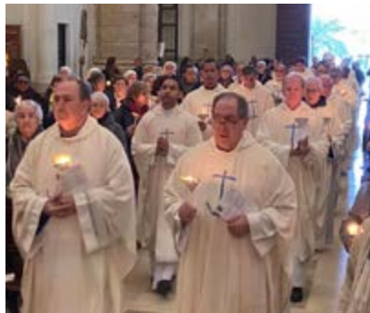
Un momento de la celebración.

Durante su homilía, Mons. García Beltrán destacó la figura de Simeón y Ana como “modelo de esperanza activa y perseverante”, invitando a los consagrados a seguir su ejemplo en su vocación y en su misión.