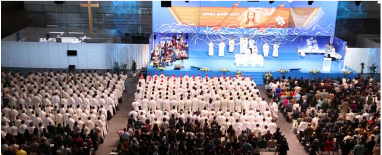
Panorámica del pabellón durante la celebración de la Misa de clausura del congreso.