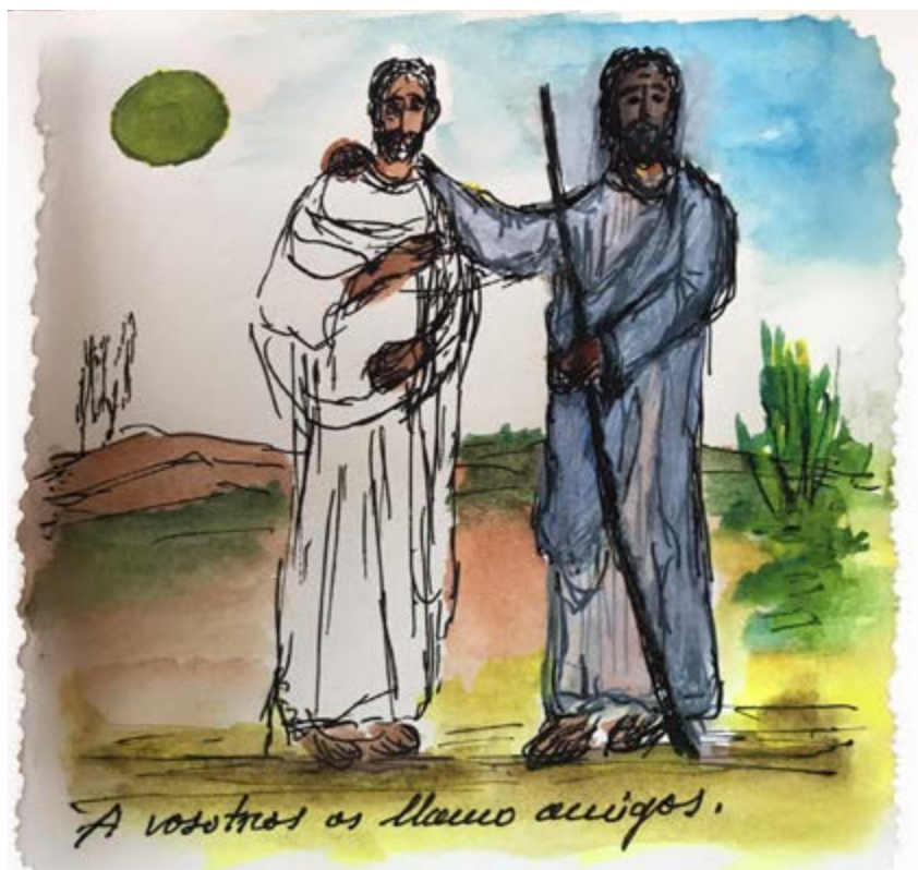
Ilustración realizada por el obispo auxiliar, Mons. José María Avendaño Perea.

• Donde la fe es el gran riesgo de la vida: "El que quiera asegurar su vida la perderá, pero el que pierda su vida por mí la hallará" (Mt 16, 25).