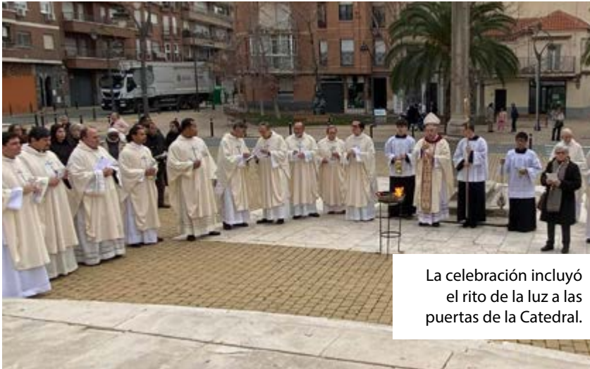
La celebración incluyó el rito de la luz a las puertas de la Catedral.