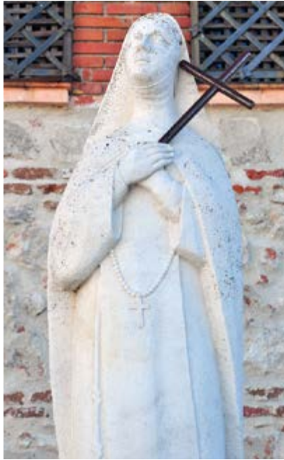
Estatua de la 'santa Juana' en Cubas.

La celebración comenzará con una procesión de entrada, en la que se portará el decreto de bea-